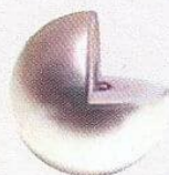
Gyöngy a Gaura Pearls-től

A cég garantálja, hogy mindegyik édesvízi gyöngyöt természetes körülmények között tenyésztették, imitált gyöngyök nélkül, és 100% tisztaságú gyöngyházat tartalmaznak, ahogyan ezen a képen is látható: