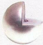
Gyöngy a Gaura Pearls-től

A cég garantálja, hogy mindegyik gyöngyöt természetes körülmények között tenyésztették, imitált gyöngyök nélkül, és 100% tisztaságú gyöngyházat tartalmaznak, ahogyan ezen a képen is látható: